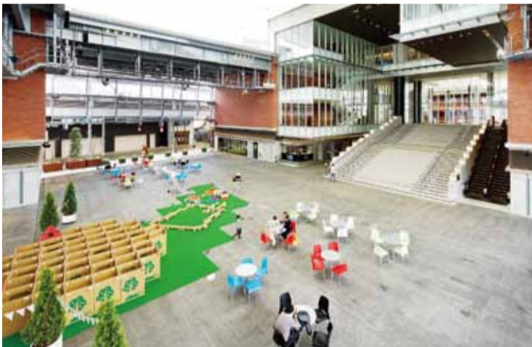
▲「まちなかシネマ」の様子。寒い季節はパラスルヒーターが登場

面積/約1,320㎡(貸出面積1,043㎡) 設備/昇降式ステージ(9m×6m)、 広場床に電気・給排水設備設置 天井高/平均約17.5m