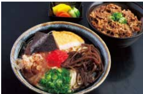
〒久留米市六ツ門町21-1 ☎0942-39-5151 🕒11:00~05:19:45 🍷火曜 〇26席 🍷なし 📱カード/不可 喫煙/不可

昭和8年創業。看板メニューは、うるめ節とかつお節で丁寧にとったスープとストレート麺が特徴の『中華うどん』(480円)。丸天や海苔、紅ショウガにネギ、ふんわりさせたほんぶしが湯気に踊りながらお目見えします。ツルっと麺をすすると鼻に抜けるスープの味が優しく、地元で長く店を営む秘訣が感じられます。国産牛肉を甘辛く煮込んだミニ肉めしが付いてくる『一平セット』(930円)もおすすめ。