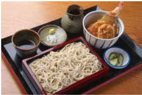
〒久留米市小頭町2-20 ☎0942-34-6734 🕒11:00~05:15:00※売切れ次第閉店 🍷水曜 〇25席 🍷なし 📱カード/不可 喫煙/不可

北海道産ソバ粉を使った二八そば。『せいろ』(640円)は冬場も一番人気で、公演の合間に役者が来店することも。衣が良い具合に薄づきで、サクサクに揚がった海老や野菜の天ぷらをのせた『小天井』(430円)は口当たり軽やかで何杯でも食べられそう。せいろとのセットがオススメです。もも肉とむね肉を手作りでミンチにした『鴨つくねそば』(1,080円)はつくねが柔らかくフワフワ。寒い時期でも味わいたい一品です。