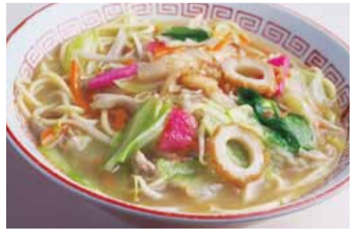
〒久留米市六ツ門町7-67 ☎0942-32-7662 🕒9:00~19:00 🍷隔週土曜 〇24席 🍷なし 📱カード/不可 喫煙/不可