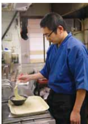
▲「中華うどん」は、ワンコインでお釣りがくるリーズナブルさがうれしい、久留米のソウルフードです