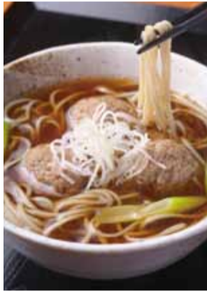
▲「鴨つくねそば」は冬限定メニュー。のどごしがツルンと心地よく、地元はもちろん、遠方にもファンが多い