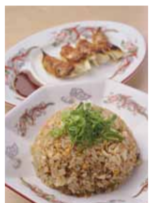
▲お好みの麺メニューにプラス480円で、半チャーハンと半餃子のセットにできます