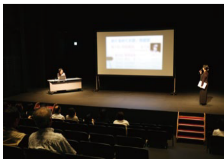
企業や団体の研修・講演会 講師を招いての講演会や発表など(写真のスクリーンは183型)