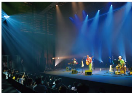
ライブやピアノの発表会 くるめライブチャレンジ2016年間チャンピオン・ワンマンライブ