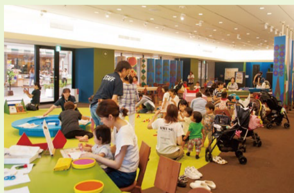
▲親子で楽しめる製作なども開催

久留米シティプラザ1階にある『カタチの森』は、誰もが気軽に立ち寄れるフリースペース。森や動物のカワイイ内装を手掛けたのは、絵本やイラストレーションなど幅広い分野で活躍するアートユニット、tupera tupera(ツペラ ツペラ)。カフェ、授乳室、多目的トイレも設置しているので、ちょっとした休憩にぜひ!