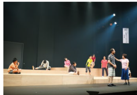
舞踏や演劇の公演 くるめ演劇塾2017発表公演「CB/バンドラ」