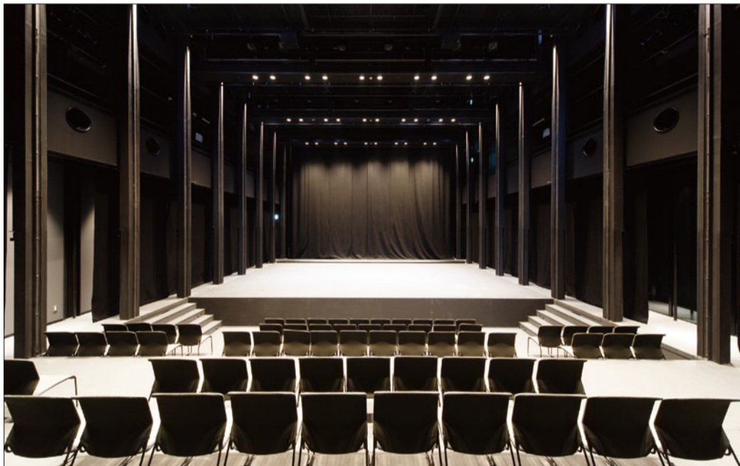
通常形式の劇場

14:00~17:00(受付13:00~) ④久留米シティプラザ和室 ⑥参加費無料※着物一式持参 ⑦花柳三枝君 ⑧090-7477-2958 ⑨0942-38-5556