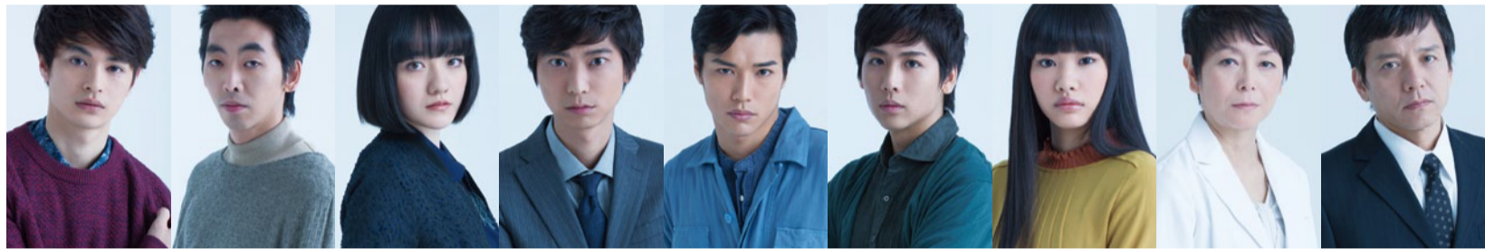
瀬戸康史 柄本時生 小島藤子 鈴木裕樹 山田悠介 池岡亮介 八幡みゆき 千葉雅子 勝村政信

チケット発売中 ①久留米シティプラザ ザ・グランドホール ②S席7,500円 CP ③L席6,000円 A席6,000円 学生券3,500円 (当日座席指定、引換時要学生証) ※全席指定、未就学児入場不可 ④前川知大 ⑤寺十吾 ⑥瀬戸康史、柄本時生、小島藤子、鈴木裕樹、山田悠介、池岡亮介、八幡みゆき、千葉雅子、勝村政信 ⑦ピクニックチケットセンター ☎050-3539-8330(平日11:00~17:00)