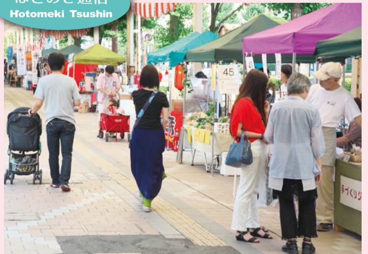
▲野菜、果物、パン、スイーツ、陶器、服飾雑貨など作り手が直接販売している