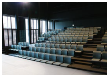
ブラインドを上げると開放的

ザ・グランドホール、久留米座、大会議室に次ぐキャパシティを誇るCボックスは、客席部分の床の高さを調節することで様々な空間を作り出すことが可能なマルチスペース。舞台や客席は可変式で、遮光して小さな劇場として公演を行うことも、明治通り側の街並みを見ながらの開放的な使用も可能。演劇、ダンス、音楽の公演、展覧会やリハーサルなど使い方のバリエーションは多彩。会場使用料は中会議室と同程度(※1)の設定なので、Cボックスを一度利用してみたいはいかがでしょうか?