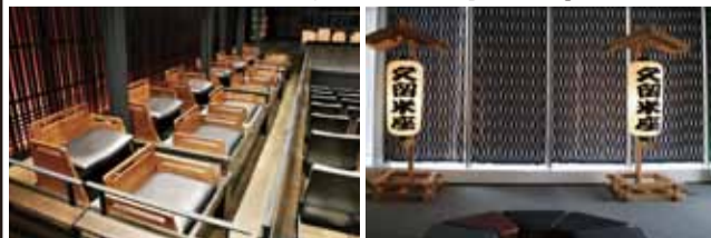
▲堂に座椅子が備わる柵席