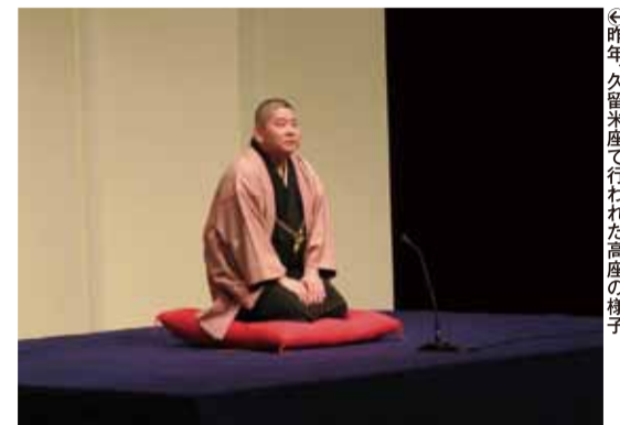
◎昨年、久留米座で行われた高座の様子

事を見慣れていっしょるようになってきました。落語に慣れていないお客様だと会場の雰囲気も固くて、そこをほぐすところから始めるので大変。反応までにちょっと間が空いて、それがどんどんずれていく時もあるんですが、久留米のお客様は落語を聞く態勢ができていてやりやすかったです。