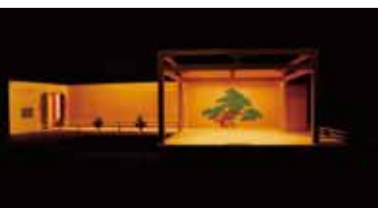
▲脇見所を持つ能舞台を設置することで、本格的な能楽を上演することが可能

照明で赤く浮かび上がる壁の格子と、両脇に据えられた柵席が印象的な久留米座は、照明、音響など充実した設備を持つ中規模ホール(座席数399席)。舞台と客席の距離が近く、後方でも演者の表情や息遣いが伝わり好評です。和モダンな空間は、能や落語など日本の伝統文化を披露するのに最適。一方で、演劇や舞踊はもちろん、毎年ライブに訪れるジャズミュージシャンやアーティストもおり、コンサート会場としても人気です。ザ・グランドホールと同等の性能を持つプロジェクターは映像が美しく、講演会や映画の上映会なども行われています。