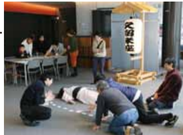
▶ワークショップ参加者が作った双六で遊ぶ来場者たち

歴史や伝説などを語ってくれる方を募集し、知り得た情報をもとに安徳天皇伝説の残る土地を取材。「はじめてのえんげき祭」で「安徳天皇潜幸双六」などを展示発表。