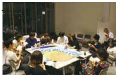
▶「子午線の祀り」を音読したり、それぞれの気づきを語ったり。作品についての理解が深まりました

壇ノ浦の合戦をモチーフにした劇作家・木下順二の戯曲を読みながら、プロの劇作家が戯曲をどのように捉えているのかを体験。安徳天皇ゆかりの地めぐりも。