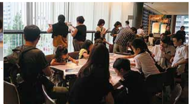
▲観劇後、子どもたちに今日感じた“キモチ”を自由に書いてもらいました！