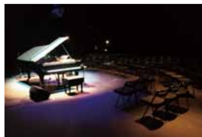
▲舞台上に客席を設けた昨秋のジャズライブ。シックな大人の空間に大変身