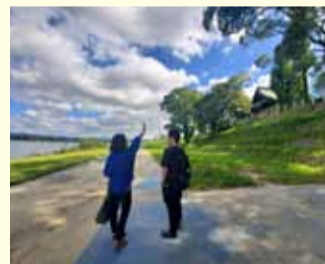
◀夏のフィールドワークで訪れた水天宮。創始者の按察使局伊勢は、安徳天皇の母である高倉平中宮に使えていた女官で、壇ノ浦の合戦後に逃れてきた