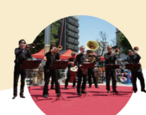
ブラックエレファント

カナダから来た、100種類以上のテクニックを持つ、圧倒的にパワフルな2人組! ジャグリングにアクロバットまで、本場のStreet Circusをお見せします!