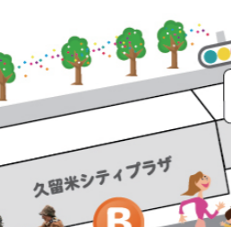
みすたーぶんぶん Mr.BUNBUN

「Luminous(ルミナス)」とは「光を発する」という意味。その名の通り、光が舞い降りたようなキラキラとしたステージを4名の女性歌手が華やかに歌い上げます!