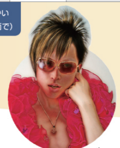
だういんち セクシー-DAVINCI