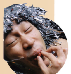
てつか サンキュー手塚

長い衣が風をはらみ、風を感じ、風を見せる。大きく、雄大に、そして華やかに羽ばたいたとき、空気は混ざり、光は反射し、強く印象を心に残す。羽ばたき舞う美しき精。