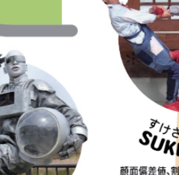
いっぺい EPPAI&マサトモジャ

踊りだしたその場所全てが、舞臺のダンスフロアに移り変わる! 交錯する影と情熱的なステップ! 映画のワンシーンみたいに美しい光景! まるで久留米が面白いヨーロッパの街角に!