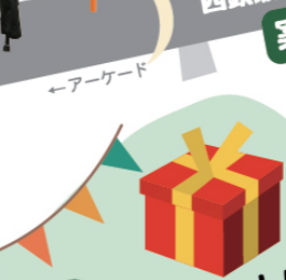
なお わがん NAO&WAGAN Brothers

不思議の森から、すーっと世界を旅してきた、さすらいの羊。せせらぎを感じさせるゆったりとした存在は、悠然と旅を続けます。