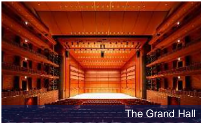
The Grand Hall