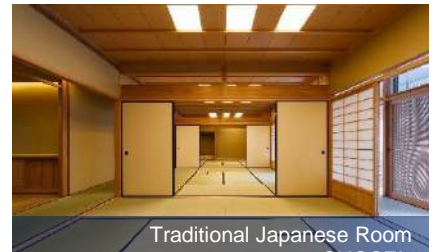
Traditional Japanese Room

京間8畳3室のすべてに炭も使える炉(電気炉併用)を備え、炭手前の稽古から茶事、茶会まで行うことができます。 定員 定員約50人(3室合計)